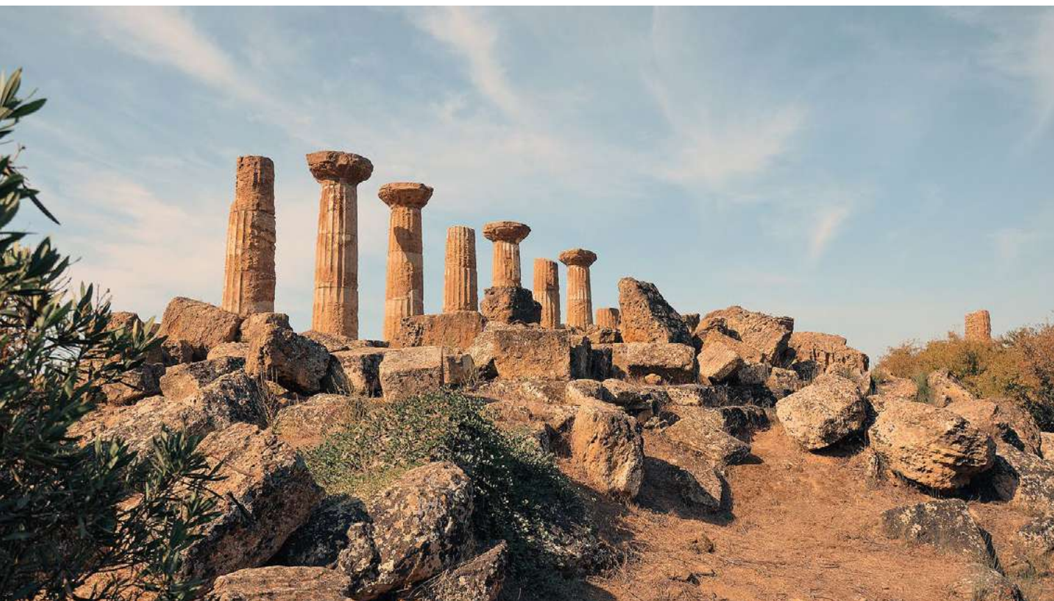
Sotto: Valle dei Templi ad Agrigento.