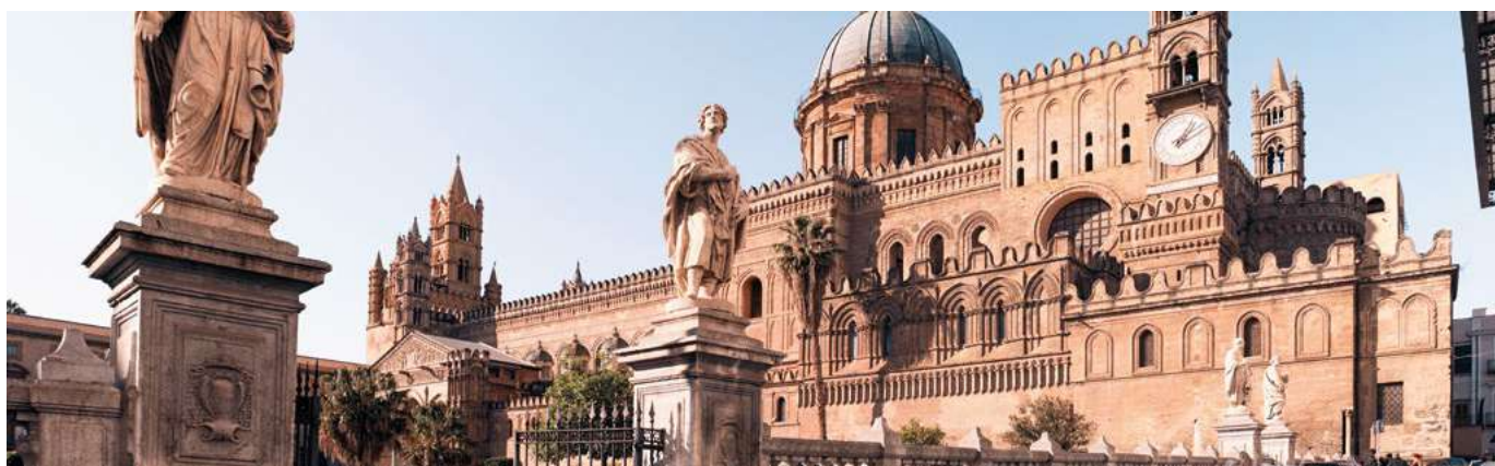
In questa pagina dall'alto: Palermo; Erice.