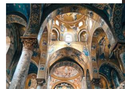
In questa pagina, da sinistra: Duomo di Monreale; Fontana dell'Amenano a Catania.

Le date sono in continua evoluzione, controlla sempre il sito o chiedi alla tua agenzia di viaggio.